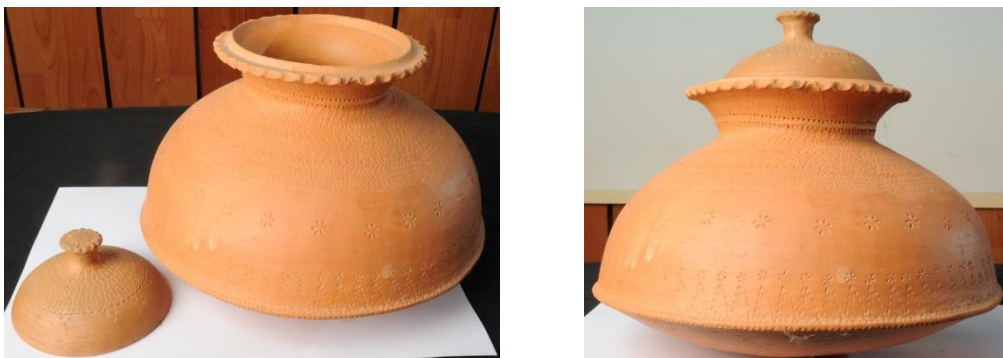
Rajah 2: Terenang tradisional